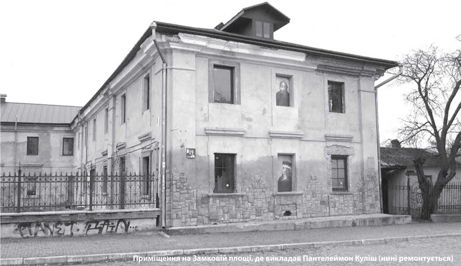
Приміщення на Замковій площі, де викладав Пантелеймон Куліш (нині ремонтується)