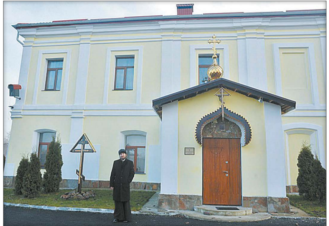
Братський корпус (колишній палац митрополита) після часткової реставрації

У домовому храмі людно. Ігумен каже, що місцевих приходиться небагато, в основному їдуть на службу до монастиря лучани.