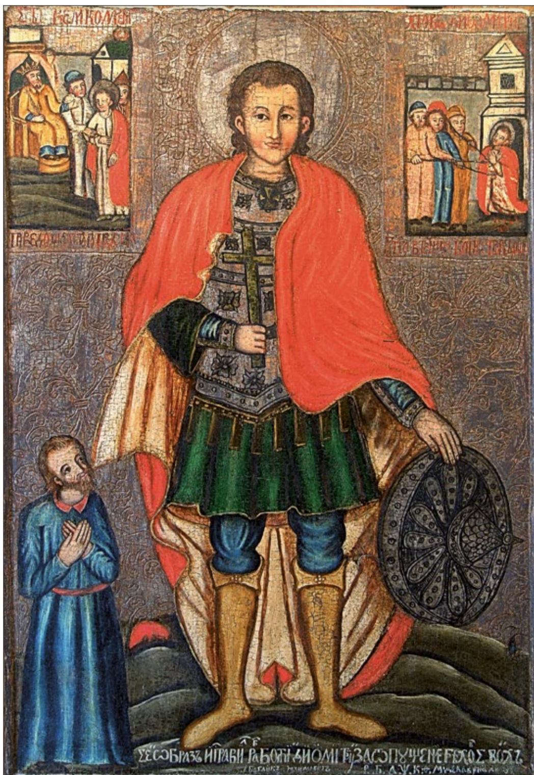
«Святий Дмитрій». 1729 р. Дерево, левкас, темпера, сріблення. Походить із каплиці Покладення ризи Богородиці с. Кримно Старовижівського благочиння

В українському живописі XVII–XVIII ст. поширилися т. зв. донаторські зображення як один із різновидів портретного жанру. Зображення донаторів (з латинської – «дарувальник») ввели до композиції образу. Це або сам замовник ікони, або особа, яку він бажав увічнити (його родич чи поважний діяч). Донаторів у XVIII ст. малювали в молитовній позі навколішках або на повний зріст. На Лівобережжі донатори у портретах – одного зросту зі святыми. На Західній Україні в ролі донаторів звичайно виступали міщани, адже вони були найдіяльнішими учасниками братств, які виступали оборонцями національних інтересів українців.