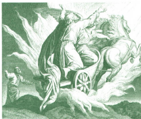
Ю.-Ш. фон Карольсфельд. Вознесіння Іллі

Найчастіше про цього великого мужа віри згадують у зв'язку з тим, що він був найближчим і найвідданішим учнем пророка Іллі. Погляньмо, як священний письменник відтворив цю сув'язь учня і наставника у відомому уривку з Другої книги царів: «У той час, коли Господь захотів піднести Іллі у вихорі на небо, йшов Ілля з Єлисеєм з Галгала. [...] Коли вони перейшли, Ілля сказав Єлисеєві: "Проси, що зробити тобі, раніше, ніж я буду взятий від тебе". І сказав Єлисей: "Дух, який у тобі, нехай буде на мені подвійно". Ілля відповів: "Важкого ти просиш. Якщо побачиш, як я буду взятий від тебе, то буде тобі так, а якщо не побачиш – не буде". Коли вони йшли і дорогою розмовляли, раптом з'явилася колісниця вогненна і коні вогненні, і розлучили їх обох, і понісся Ілля у вихорі на небо. Єлисей же дивився й вигукнув: «Батьку мій, батьку мій, колісниця Ізраїля і кіннота його! І не бачив його більше. І схопив він одяг свій і роздер його на дві частини».