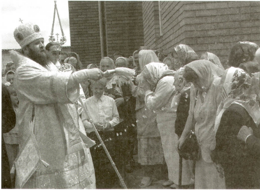
Освячення новозбудованого храму в с. Лище Луцького благочиння, 7 липня 2004 р.

31 травня виповнюється рік від часу приходу на Волинську кафедру єпископа Михаїла, який до того очолював Сумську і Чернігівську єпархії. Багато священників і мирян розцінили Патріарше новопризначення як подію року в Церкві Київського Патріархату на Волині. Адже тоді, можна сказати, стався переломний етап в історії Волинської єпархії. Вона зажила і запрацювала по-новому. Про неї знову стали говорити.