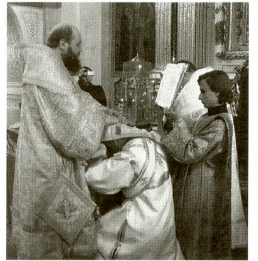
Висвята на диякона

Масовий хресний хід відбувся до Холмської ікони Божої Матері, а також чи не вперше за кілька десятирічків років – через парк культури й відпочинку імені Лесі Українки. На центральному пляжі у Стиру відбулось велике освячення води. Це відродження давніх традицій, які існували на Волині ще за часів Лесі Українки. Уперше за всю історію Волинської єпархії в Луцьку проведено загальноміський страждальний хресний хід Великої П'ятниці. Владика ніс хрест на зразок того, як його на Голгофу ніс Сам Ісус Христос. Під час ходу священники