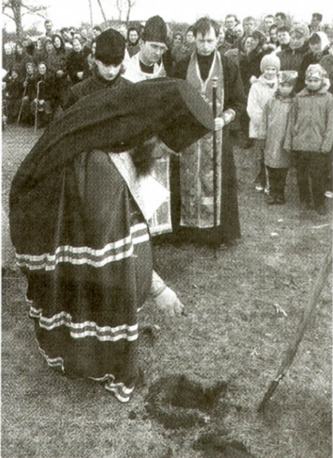
Освячення місця під будівництво храму св. Петра й Павла в с. Холпів Ківерцівського благочиння, 27 березня 2005 р.

Великих проблем завдала пожежа, що спалахнула в ніч з 30 на 31 березня у