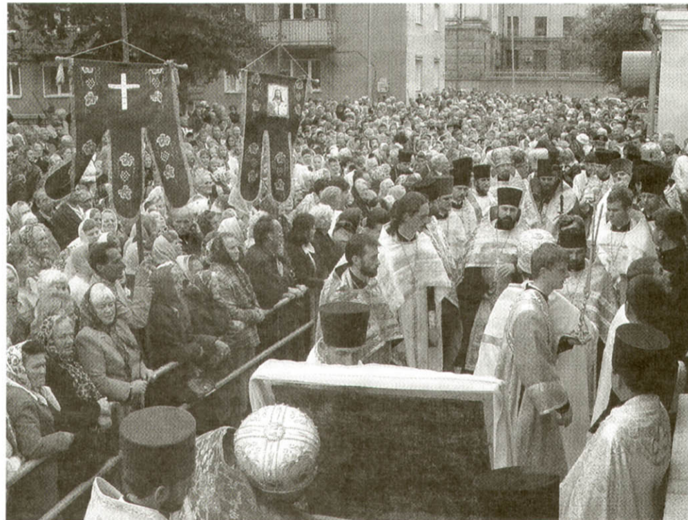
Паломництво до чудотворної ікони Холмської Богоматері, 21 вересня 2004 р.

Волинській духовній семінарії. Дотла згоріло приміщення, збудоване з дерева та очерету на початку 20-х років минулого століття. Зусиллями студентів семінарії місце пожежі було очищене. Тепер тут постане сучасне