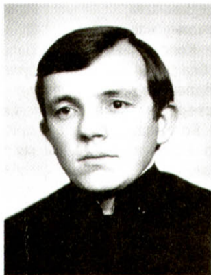
Дякон, 3 курс семінарії, 1981 р.

1978 року він стає вихованцем Ленінградської семінарії. Згодом співає у семінарському хорі. Навчання, як згадує, не було важким: хто хотів учитися, той вчився. Єдиною трудністю для уродженця Львівщини була російська мова. Згодом