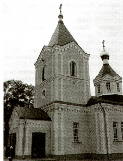
Наступного року громада відзначатиме 100-річчя храму

Вирішити цю проблему, отець Богдан вважає, можна. Треба розвивати місійну діяльність. Якщо людина не йде до храму, то треба приходити до неї, розповідати про ази Православ'я, про суть віри, про Страждання Ісуса на Хресті. Необхідно, щоб людина зрозуміла, що Христос прийшов на цю землю спасти нас, бо після цього життя, тимчасового, нас чекає життя вічне. І тоді вже виправити не можна буде нічого. Священник повинен донести до людини, що за кожен вчинок їй доведеться відповідати, тому нині вона, задумавшись