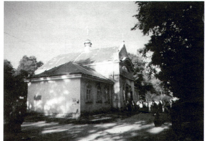
Церква в Турковичах (Польща).

Микола ОНУФРІЙЧУК, голова Волинського громадсько-культурного товариства «Холмщина»