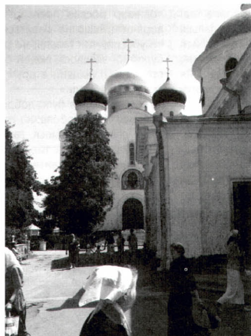
Монастир в Одесі, де спочив преподобний Кукша