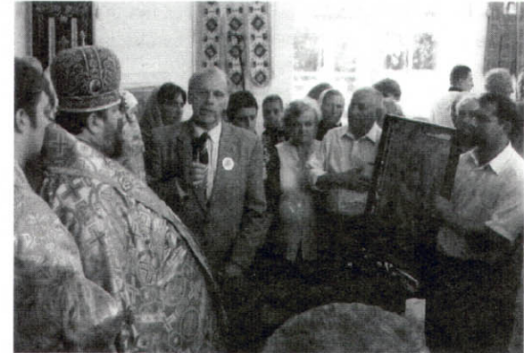
Група паломників Волинського товариства «Холмщина» принесла в дар православній церкві в с. Турковичі (Польща) Вишгородську ікону Божої Матері.

Відтоді Турковицький монастир знову став осередком духовності Холмського краю. Століттями 15 липня – у день з'явлення образу Матері Божої – в Турковицькому монастирі відбувався відпуст на честь чудотворної ікони, який тривав кілька днів. У міжвоєнні роки тут збиралися десятки тисяч прочан зі своїми священиками, архієреями, церковними хорами. Привозили сюди калік, хворих, які їхали з вірою на одужання та зіллення. Молодь різних сіл змагалася у співах. Виконували духовні й українські народні та авторські пісні. Це були своєрідні фестивалі, які єднали наш люд.