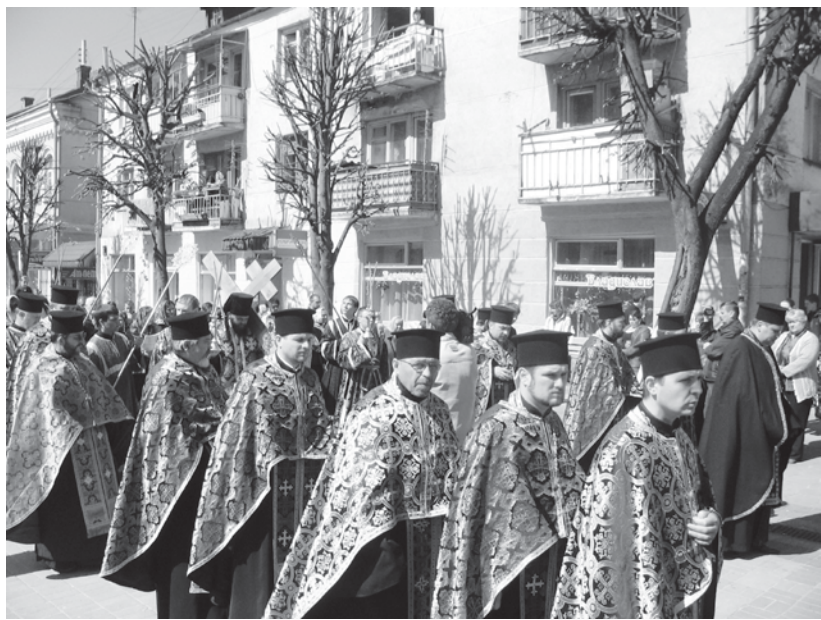
Страсний хресний хід у Велику п'ятницю. Луцьк, 25 квітня 2008 р.

Архієпископ Михаїл благословив до друку книгу «Пасії. Страсний хресний хід». Її можна придбати у храмах та церковних крамницях і молитися на цих великопісних службах кожен зі своїм примірником.