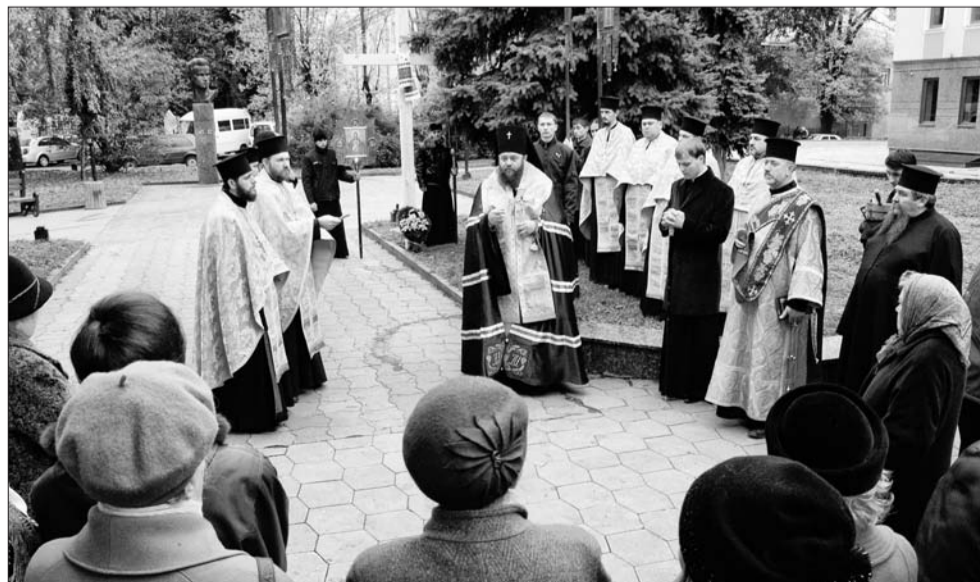
Тут постане каплиця Волинської ікони Богоматері.

ти ближчими свої реліквії. На жаль, за імперських часів і держава, і Церква насаджували переважно набутки російського Православ'я. Тож волинняни краще знають, наприклад, святих Серафима Саровського чи Сергія Радонезького (а це справді великі угодники Божі), ніж волинських святих. Знають, коли день Казанської ікони Богородиці (а це справді видатна святиня), але рідко хто знає, коли день ікони Волинської. У нашій єпархії нема жодного храму на честь Волинської ікони! Тому ця каплиця нехай зветься так. А Іверський образ хай більше вшановують православні Грузії (Іверія – давня назва цієї країни), звідки він по-