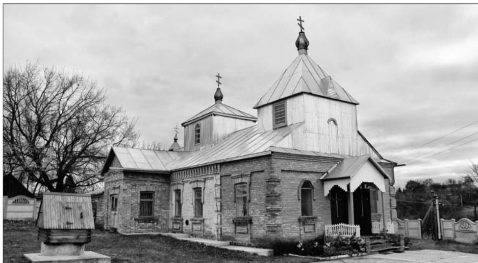
У Баківцях.

ходить, Росії, бо в Москві є його шанована копія, тощо».