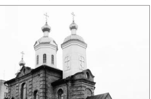
Володимирська церква.