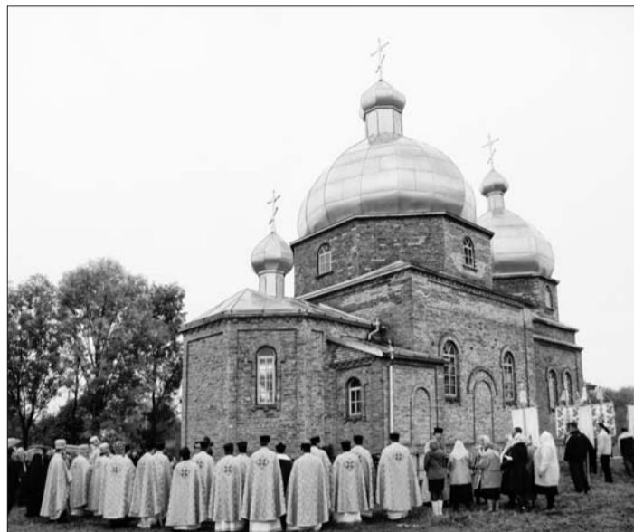
Храм у Фалемичах.

17 жовтня високопреосвященний освятив хрест і місце під будівництво каплиці Волинської ікони Божої Матері у цьому сквері. З архієреєм співслужили канцлер протоієрей Микола Цап, декан кафедрального Троїцького собору протоієрей