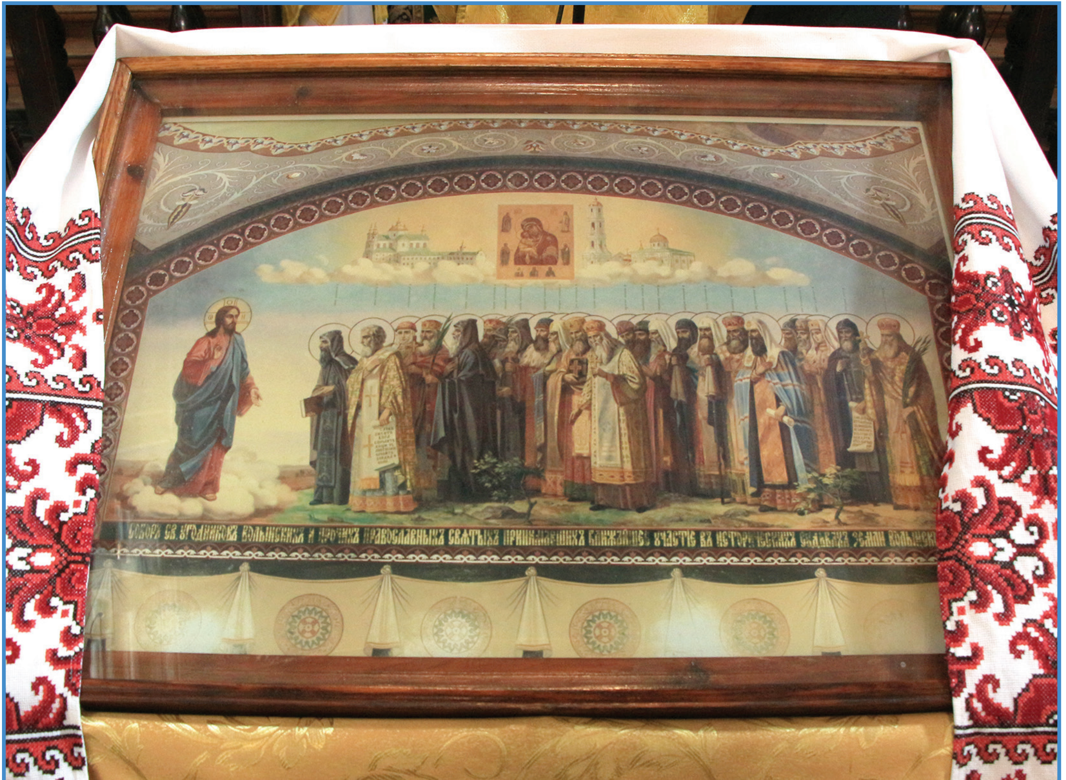
Нещодавно єпархія урочисто святкувала Собор волинських святих і відзначила актовий день Волинської православної богословської академії. Як це відбулося – читайте на с. 5