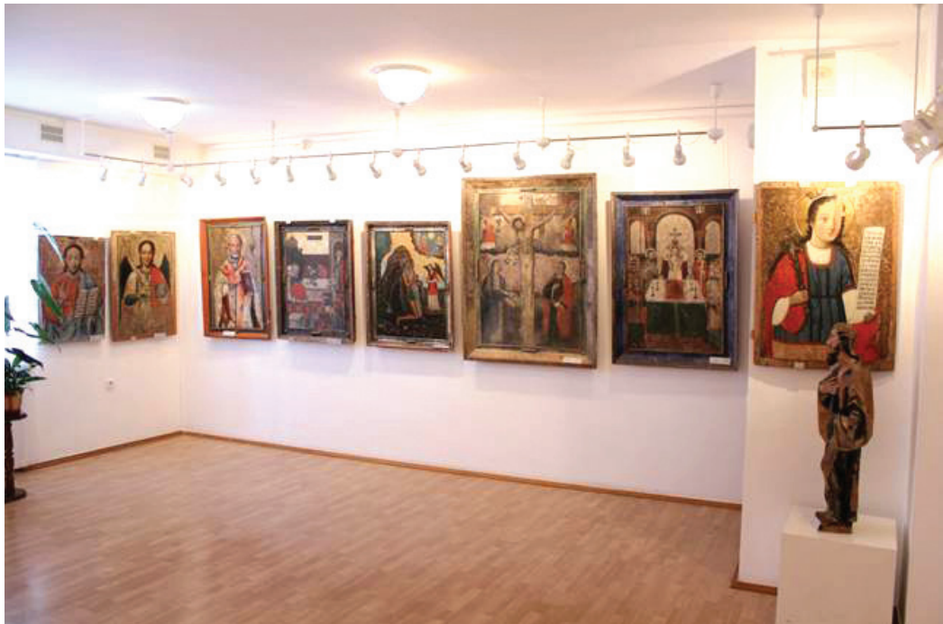
Один із експозиційних залів Музею волинської ікони