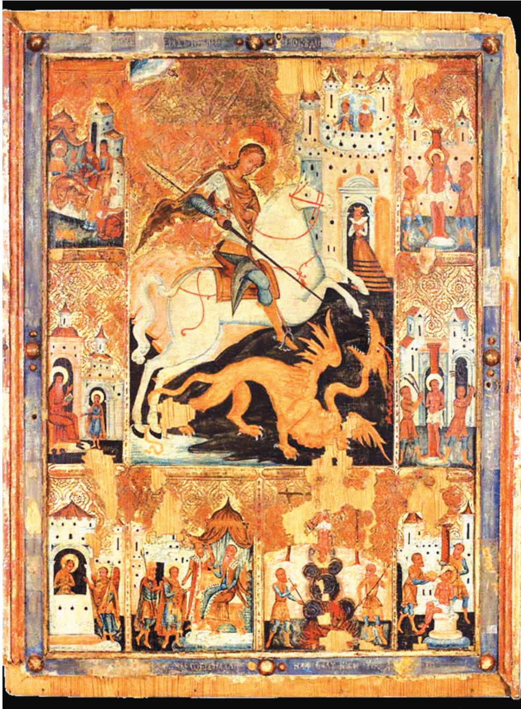
Ікона «Юрій Змієборець із житієм», 1630 р., віднайдена в с. Бобли Турійського р-ну 1982 р.

Показник цивілізаційної зрілості держави бачимо у ставленні суспільства до своєї національної духовної історико-культурної та мистецької спадщини, як ми її зберігаємо і як пропагуємо.